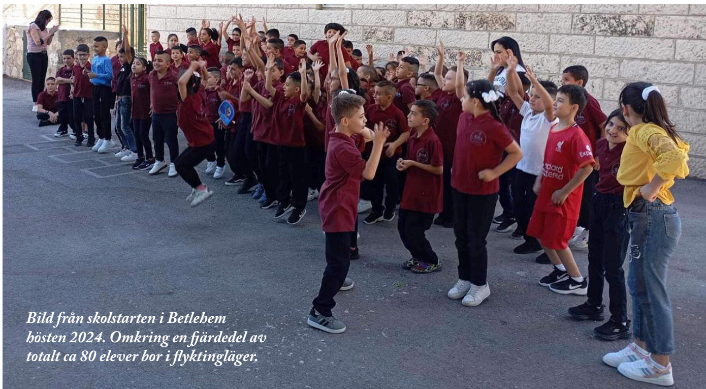
Bild från skolstarten i Betlehem hösten 2024. Omkring en fjärdedel av totalt ca 80 elever bor i flyktingläger.

I hjärtat av Betlehems flyktingläger, där livet är osäkert och tufft, finns det barn som fortfarande drömmer. Barnen går på SIRA-skolan och de bär på en längtan efter en annorlunda morgondag.