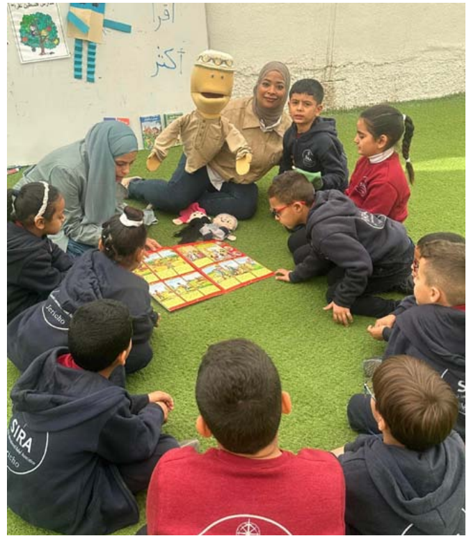
Gemenskap och närhet i små grupper främjar inläringen och ger eleverna trygghet, som här på skolan i Jeriko.