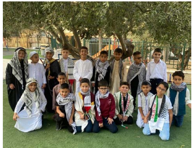
Hembygdsdag i Betlehem med traditionell klädsel under ett av skolans olivträd. Att skörda oliver är en höjdpunkt under hösten.